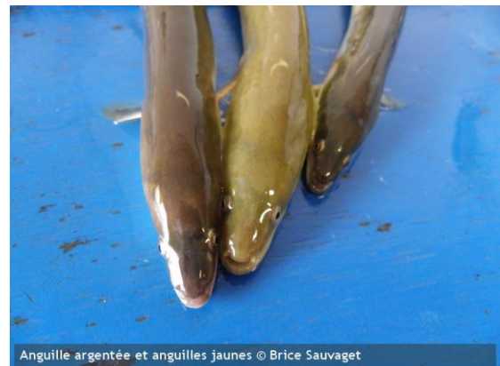
Anguille argentée et anguilles jaunes